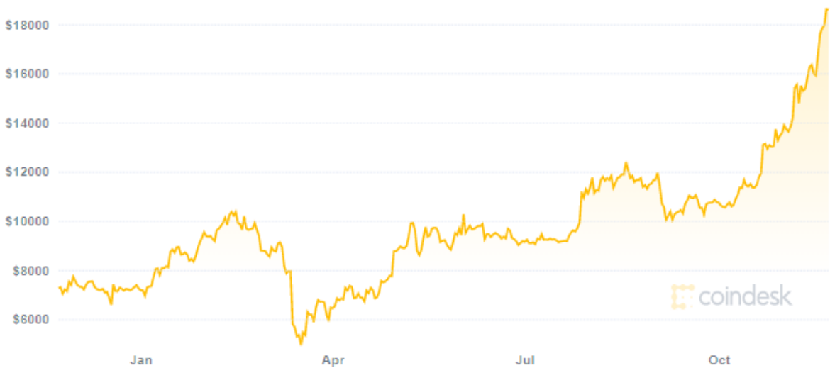
Figure 1: